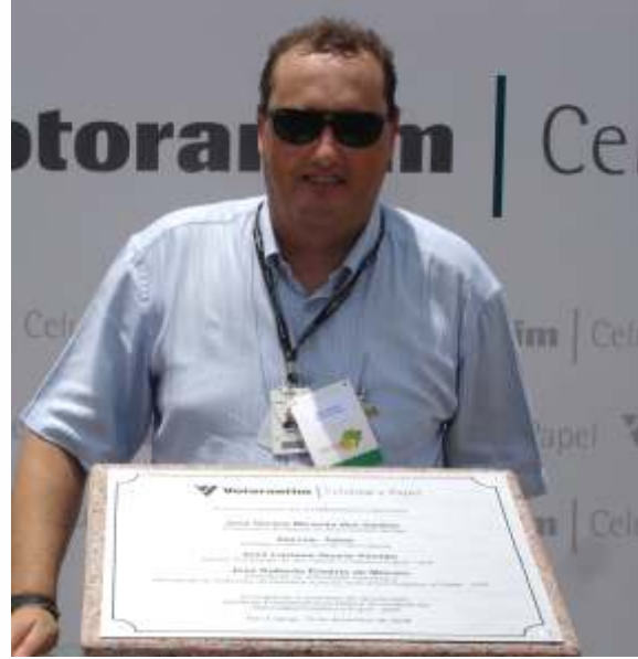
Julio Ohlson Gestão Florestal, Greenfields/Brownfields