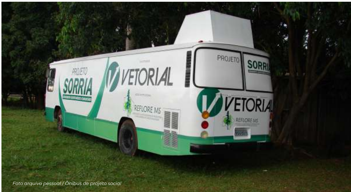
Ônibus de projeto social