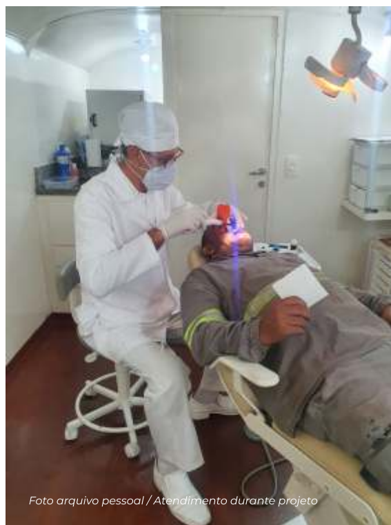
Atendimento durante projeto