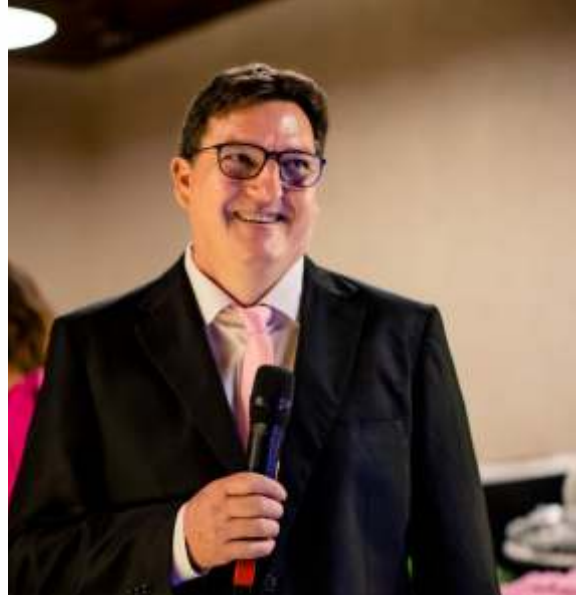
Giovani Nesello Desenvolvimento e Produção: Global Prime Wood